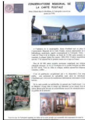
F - 2 -