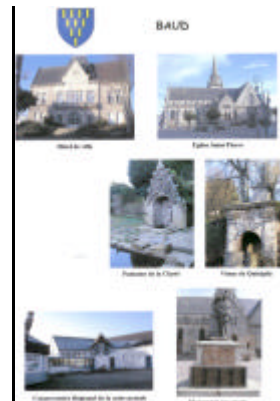
F - 4 -