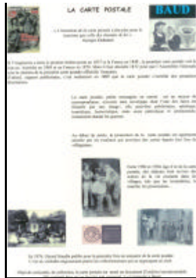
F - 3 -